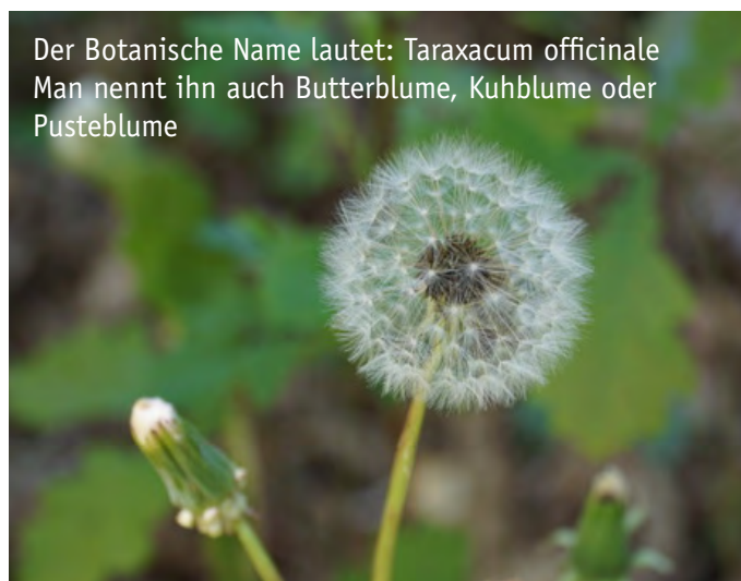
Der Botanische Name lautet: Taraxacum officinale Man nennt ihn auch Butterblume, Kuhblume oder Pusteblume

Die Blätter des Löwenzahns bilden am Boden eine Blattrosette. Sie sehen gezackt aus, Botaniker sagen auch, dass der Rand schrotsägeförmig ist. Die Blüte besteht aus ganz vielen Blütenblättern, das sind die Zungenblüten. Oft findest du Bienen, Hummeln oder Käfer auf der Blüte. Der Löwenzahn blüht von März bis in den September hinein. Wenn du eine Löwenzahnblüte mit